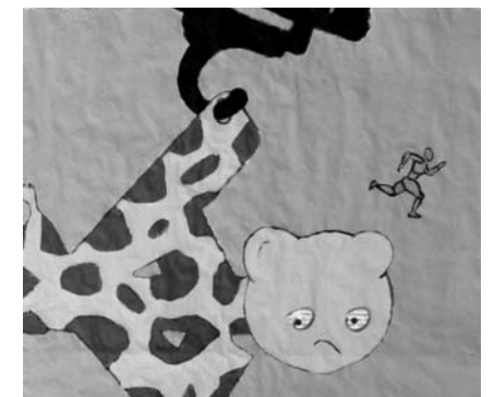
Un périlleux exercice de démocratie directe

On voit là que résister à l'envie de « mettre de l'ordre dans tout ça » permet de ne pas bousiller les apprentissages en respectant le processus. Nous avons expérimenté collectivement, en temps réel, une démocratie vivante, directe, respectueuse des différences, qu'on peut réinvestir dans notre vie quotidienne. Les milieux de la militance étant souvent le théâtre de manipulations et dominations, nous avons tout à gagner à nous inspirer de cet exemple d'intelligence collective. Nous avons assisté et contribué à un véritable processus d'émancipation politique.